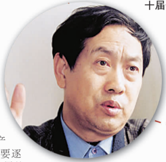
国家行政学院教授 汪玉凯