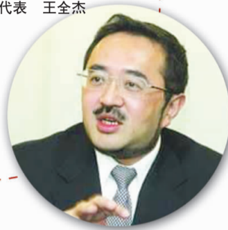
全国人大代表 韩德云