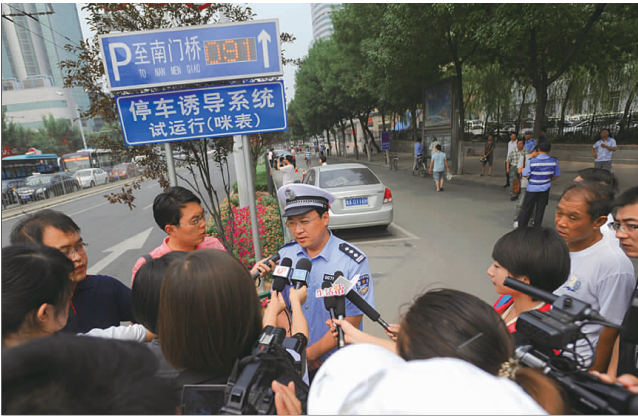
济南咪表的试运行引来诸多媒体的关注。

随后,记者在泺源大街东首路口上方发现了“停车诱导系统试运行(咪表)”的牌子,沿路的咪