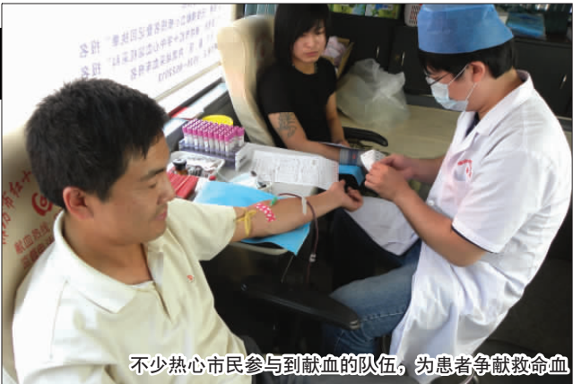
不少热心市民参与到献血的队伍,为患者争献救命血

连续一个月以来,为了给患者及时供应新鲜血浆,潍坊市中心血站的血源科、成分科、检验科和血供科等多个科室每天加班到凌晨 1 点多为患者提取新鲜血浆。