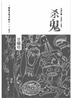
《杀鬼》 甘耀明 著 中国友谊出版社

小说是有形状的。有的小说像一条路,在读者眼前铺开,通向某个可以期待的地方。有的小说则像是一个迷宫,将读者引入其中,抛向混沌,同时让你与各种意外的意象缤纷而遇,当然,也很容易迷路。读者在游览这样的迷宫的时候,需要设定参照物来确定坐标。