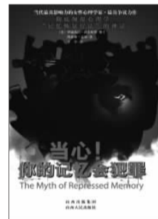
《当心!你的记忆会犯罪》 【美】伊丽莎白·洛夫特斯 凯瑟琳·克禅 著 山西人民出版社