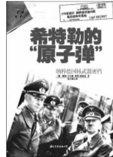
《希特勒的“原子弹”：纳粹德国核武器密档》 【德】赖纳·卡尔施 海科·德曼 著 国际文化出版公司

什么是传统?传统不是从天上掉下来的,有了张元济、陆费逵、王云五,出版业就有了传统;有了蔡元培、张伯苓、竺可桢,大学就有了传统;有了黄远生、邵飘萍、张季鸾,报业就有了传统;有了蒋抑卮、陈光甫,金融业就有了传统。《从龚自珍到司徒雷登》涉及的人物,他们的生平有一些线索都和杭州有关,遵循由人物而入手时代的原则,作者将这本书视为“西湖版”百年中国史。龚自珍、胡适、徐志摩、竺可桢和司徒雷登等20多个推动历史进程的大师先后出场,演绎着一幕幕精彩的故事。