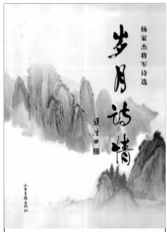
《岁月诗情》 杨家杰 著 山东画报出版社

《岁月诗情》以现代意识烛照历史,寻找民族文化精神的本原性构成,用旧诗体去书写并阐释诗歌主题的当代性,不失为一种开拓和创新,从另外一种意义上来说也是对诗歌现代化转型的演绎和推进。无论是感怀、唱和还是思辨,都能彰显出诗人的现实感受力,历史洞察力和哲学思辨力,诗人着眼于比兴寄托,但却摒弃了词藻的华靡之音和意象的雕琢之气,看似平淡疏朗,其实“言在耳目之内,情寄八荒之表”,使作品充满了现实情感,历史质感,当然更多的还是责任担当。