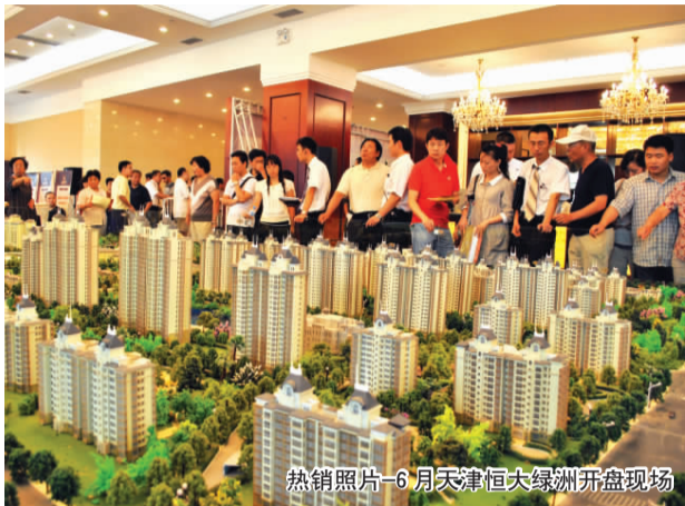
热销照片-6月天津恒大绿洲开盘现场

分析人士认为，恒大在严峻的市场形势下能取得如此骄人的业绩，关键是提前预判宏观形势，并提前采取了应对调控的行动。提前布局二三线城市，是恒大在此轮调控中所受