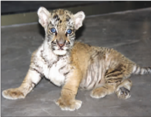
小家伙很可爱。

本报7月19日讯(记者 王光营)虎年逛动物园您肯定会对年前引进的四只孟加拉虎孟孟、佳佳、拉拉、虎虎特别留意。近日,孟孟和佳佳喜得一虎妞,如今小家伙已经接近两个月,不久就能与游客见面。但小虎妞还没有正式的名字,期待着您来给它起个响亮的名