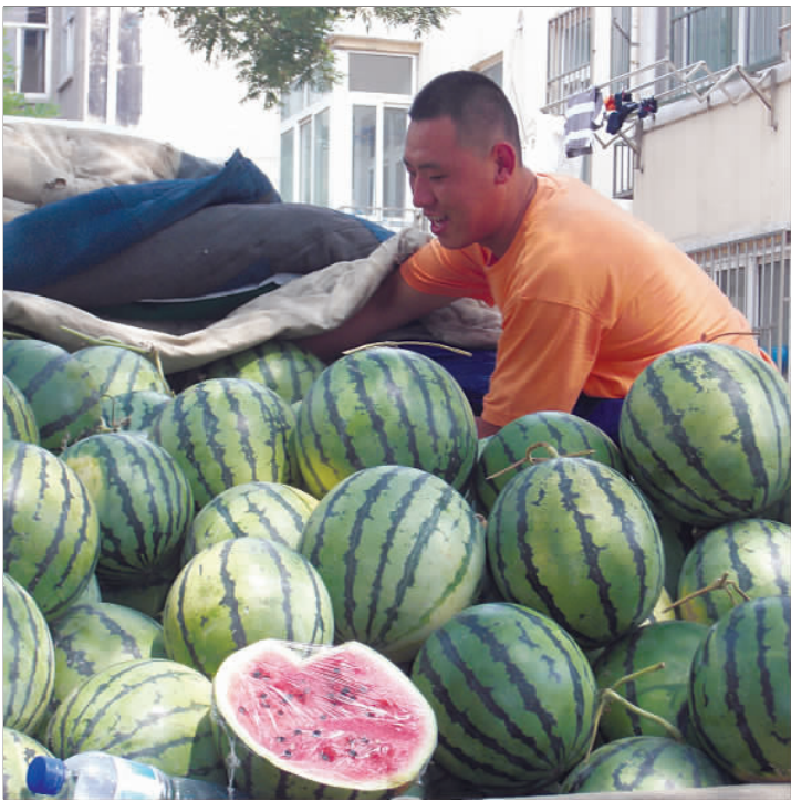
老吴卖瓜,担惊受怕。