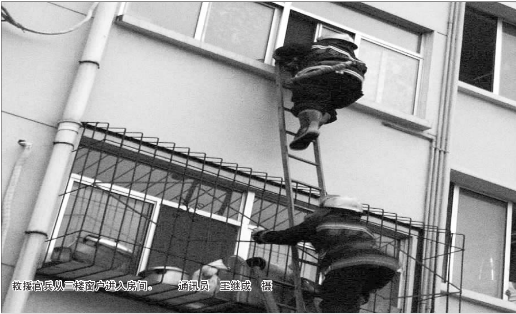
救援官兵从三楼窗户进入房间。

解放军第88医院的工作人员表示,目前该男子已经脱离了生命危险,但是现在情绪不稳定,带有明显的抵触情绪。