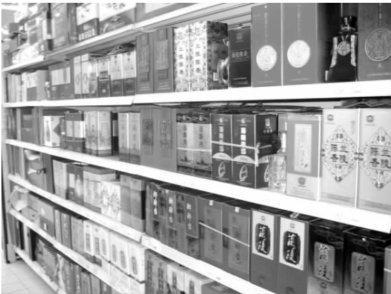
▲历史悠久的地产酒是老酒客们的热门选择。