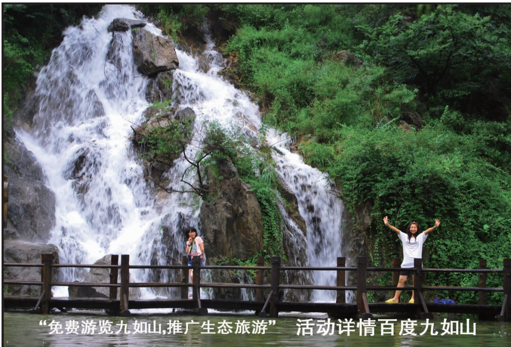
“免费游览九如山, 推广生态旅游”活动详情百度九如山

本次活动有300余名单身男女通过网络报名参加, 现场报名更加异常火爆, 总计近千人参加此次相亲活动。(苏旭)