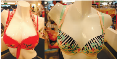
imi's 260 元