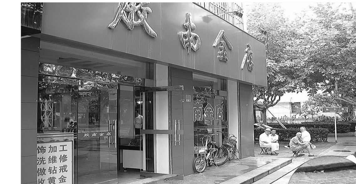
▲被抢金店恢复营业。

本报青岛8月6日讯(记者 苑菲菲 赵波) 持枪、戴头盔、穿雨衣、拿板斧,两男子下午趁大雨闯