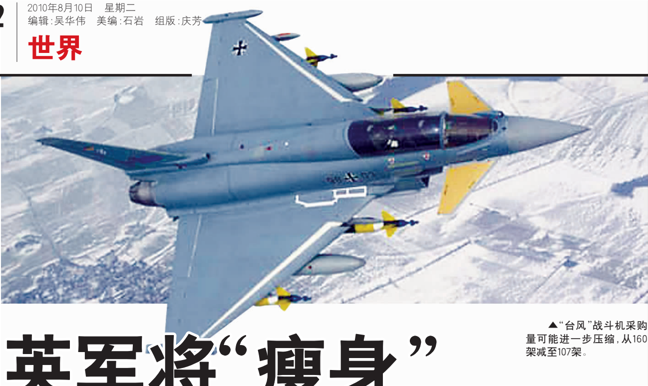
▲“台风”战斗机采购量可能进一步压缩,从160架减至107架。