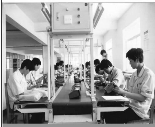
学生们在上电子实训课