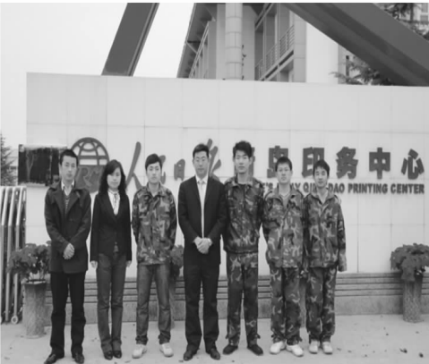
就业处领导到人民日报印刷厂看望实习同学

由于完善的就业安置和跟踪服务体系，学院现在的就业安置率达到100%，毕业一到两年内工作稳定率均达80%；实习结束后，至少25%的学生走上了管理岗位。对此，陈昌金院长还有更高的期许，他说：“希望在不久的将来，我们的学生中也能走出硕士和博士，学生的就业档次也能有进一步的提高！”