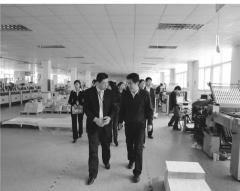
学校领导深入企业一线了解学生工作情况