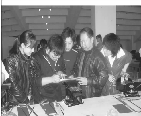
实训老师指导同学们制作模具

自2001年建校以来，青岛恒星职业技术学院就把做好学生就业作为学校的一项首要任务，紧紧围绕这一任务开展各项工作。使学院的就业工作已经取得了骄人的成绩，其中2008年学院就业率在全省民办高校中名列第一，2009年就业率高达98.9%，比2008年增长了2个百分点。近日，省教育厅领导视察学院时，对其就业工作给予了高度评价，说：“有这样的民办高校，学生的就业工作绝对有保障。”