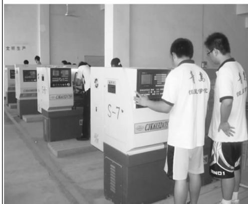
数控专业同学在上实训课