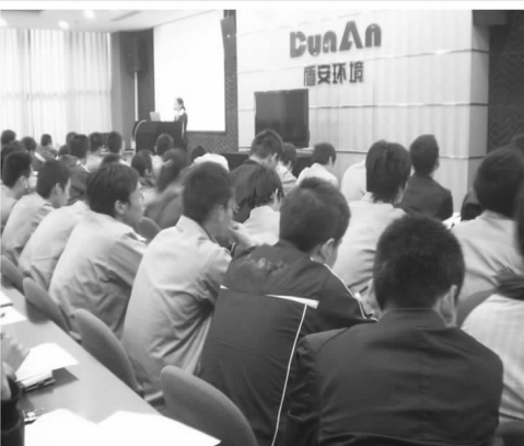
部分同学入职浙江盾安环境有限公司