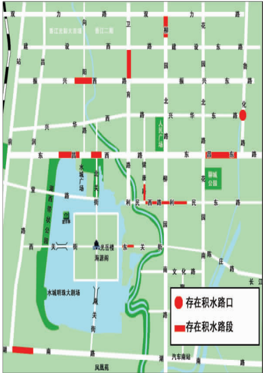
聊城城区积水示意图。(叶成虎 制作)

着肉类和蔬菜。 一家经营玉床生意的店主说:“地下室里放的玉床板、加热板全被水泡,一下子损失了十多万元。”记者沿街查看了10个店铺,看到仅冰箱就被淹了12个,另外被淹的东西还有空调、床、家具、面粉、菜等,12家店铺的地下室里全进了水,水深在30厘米左右,里面的东西全被泡在水中。 一门店的刘女士告诉记者,她将这种情况反映给了物业,“物业说建设路下水道比地下室高,地下室排水不便,要彻底解决,工程量很大。”