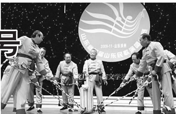
在山东省首届民歌演唱大赛中,黄河号子夺得原生态民歌组一等奖。

八家王子争江山。”还有一些号子,不分时间地点,随时可用,如:“打罢一场又一场,要打刘秀走南阳。走到南阳迷了路,遇见石人在路旁。问他十声九不答,马上妒恼汉三王。刷拉拉宝剑出了鞘,要宰石人在路旁。石人一看事不好,背后露出字两行。一条大道湖阳县,一条小道归神庄,湖阳访出名马武,归神庄访出姚期况。”等等。从开船直到停船,每一劳动过程,都有号子伴奏。每年的春秋两季,黄河中下游会筑堤建坝,以防黄河泛滥成灾。筑堤打坝时喊的号子为打碛号子,成百上千的人一起打碛时一掂一打,一快一慢,领号人歌词的即兴变化,众人齐声跟喊,那阵式叫一个壮观,那高呼与呐喊顺着黄河日夜奔腾着……在号子的鼓动下,每个人都神清气爽,斗