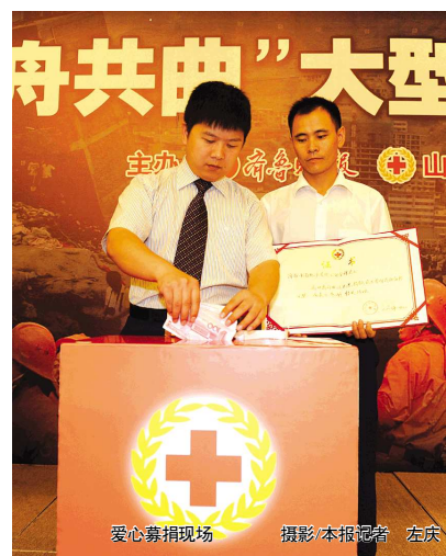
爱心募捐现场