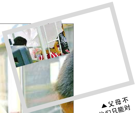
▲父母不在,他们只能对着电视发呆。