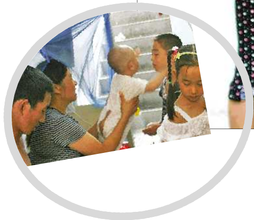
◀能和父母一起吃饭,真开心。