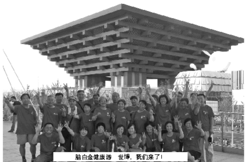
脑白金健康游 世博,我们来了!