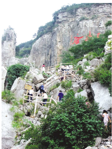
险峻雄伟的熊耳山

我们的第一站是枣庄“江北水乡、运河古城”城市名片上的核心景区——台儿庄运河古城,这里虽然只开发了一小部分,但却有挡不住的魅力:小桥流水,垂柳依依;古道茶社,相映成趣;置身其中,徐徐而行,让人宛若梦回江南水乡,陶醉不已;亲身体验过台儿庄运河古城的古色古香,小记者们又来到台儿庄大战纪念馆,在这里通过展厅图片以及观看电影片段,加深了对台儿庄战役的