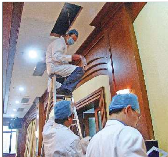
疾控中心工作人员在检测空调。

夏季是使用空调的高峰季节。连日来,济宁市疾控中心对该市城区公共场所的集中空调通风系统进行卫生检测。检测结果显示,集中空调通风系统清洗率非常低,只有不到两成的单位定期清洗空调通风系统。与此密切相关的空调清洗公司也出现生意惨淡的局面,甚至有的公司靠维修空调维持“生计”。