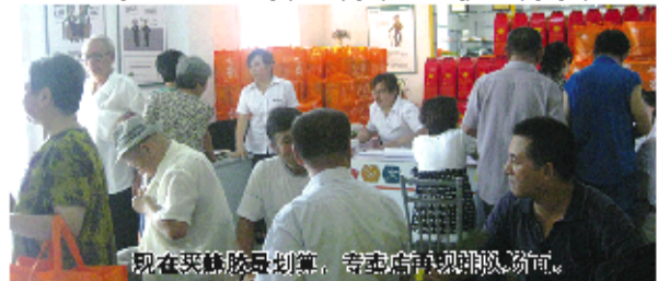
现在买蜂胶最划算,专卖店亲眼排队咨询。

含量过高的假胶劣胶 知蜂堂拥有亚洲储量第一的储胶罐,符合国家药品生产的GMP标准生产环境,确保了每一粒蜂胶的品质,而没有实力的小厂家买不起也储存不了大量的蜂胶,他们往往会用黄铜含量很高的树脂胶和真胶混合生产蜂胶(闻起来会有树脂的味道),并以超低价格诱惑消费者,服用后,反而对身体造成了很大伤害。