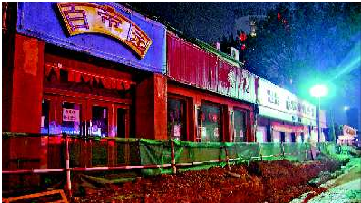
文化东路的三家餐馆同时停业。