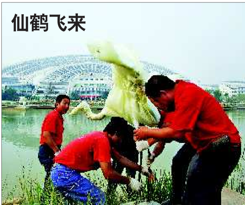
30日,工作人员正在德州太阳谷微排大厦前安装仙鹤雕塑。