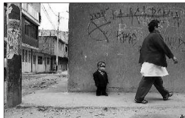
埃尔南迪斯(左)正在等车。

本报讯 据美国媒体报道,身高仅70厘米的哥伦比亚男子爱德华·尼科·埃尔南迪斯近期获得吉尼斯世界纪录最矮男人的称号。