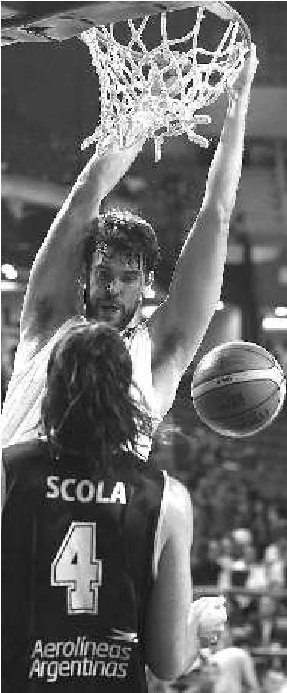
12日,西班牙队球员马克·加索尔(上)在比赛中扣篮。当日,在土耳其伊斯坦布尔进行的2010男篮世锦赛第五、六名排位赛中,西班牙队81:86不敌阿根廷队。

尽管现场的深圳警方迅速调集力量欲稳定住现场的局面,但愤怒的深圳球迷却不依不饶,路边的石头和砖头成为他们的武器,砸向青岛中能的大巴,青岛队3名球员被砸伤,所幸伤势并不严重。(综合)