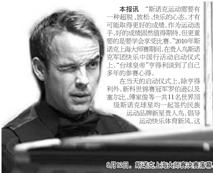
9月12日,斯诺克上海大师赛决赛落幕,卡特10:7击败伯内特,赢得冠军。图为卡特在比赛中。