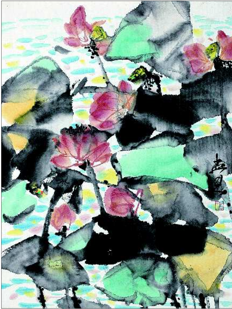
▲情系南塘系列之一