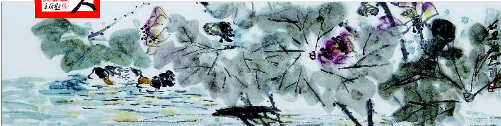
▲情系南塘系列之一