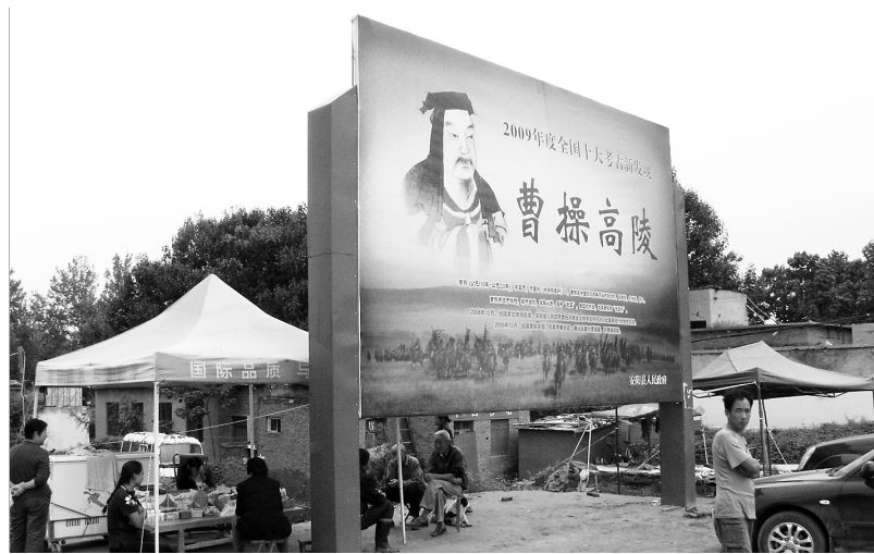
▲西高穴村附近竖起的巨大的“曹操高陵”广告牌,让外界质疑安阳市急于将曹操墓“变现”。