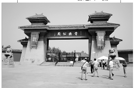
曹操公园将被打造成亳州市文化产业园区。