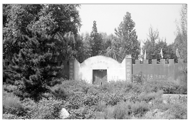
邯鄲三台景区内杂草丛生。