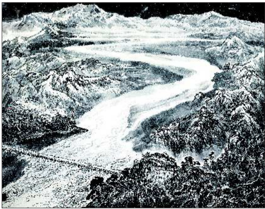
▲《万里黄河第一桥》 山水画 王旭东