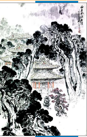
▲《孔林杏坛》 山水画 王旭东

在教学和创作的同时,王旭东著有《中国画传统与创新》、《中国画笔墨技巧》等数十本学术专著。1991年香港出版《王旭东画集》(海外发行),1992年香港出版《中国山水画技法》(中日文版),2000年北京出版《名家经典—王旭东画集》,其从艺五十年,成果显著,为国内外画坛所瞩目。1985年日本出版的《中国画家名鉴》与1998年美国出版的《美洲文艺周刊》均有专题介绍。2007年《美国波特兰文艺》发表专题报道《著名国画大师王旭东与他的齐鲁风光》,2010年《21世纪艺术大师—王旭东》由澳大利亚国家多元文化出版社向世界陆续推出的最具学术性和权威性大型艺术图书系列之一。该系列图书于澳大利亚国家图书馆、美国国会图书馆、英国大不列颠图书馆等世界顶级文化馆藏机构注册登录,并永久珍藏。其传略及作品入选《世界华人艺术家成就博览大典》、《中国现代书画篆刻界名人录》、《中国美术书法界名人名作》等90余种辞书,并荣获国际文化交流荣誉金奖、文化使者和美国洛杉矶荣誉市民等称号。