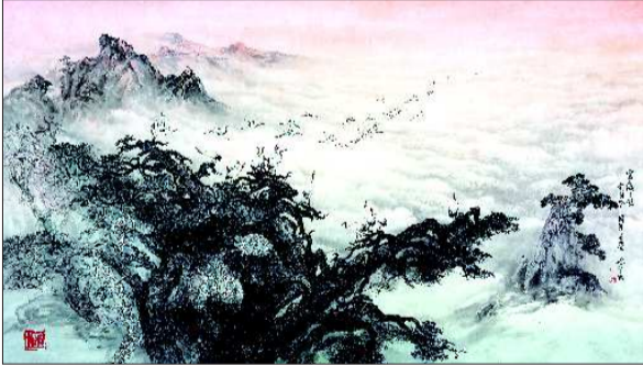
▲《济南趵突泉》 山水画 王旭东