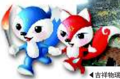
吉祥物瑞狐——“伶俐”、“俐俐”。