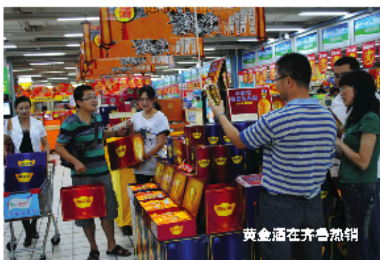
黄金酒在齐鲁热销