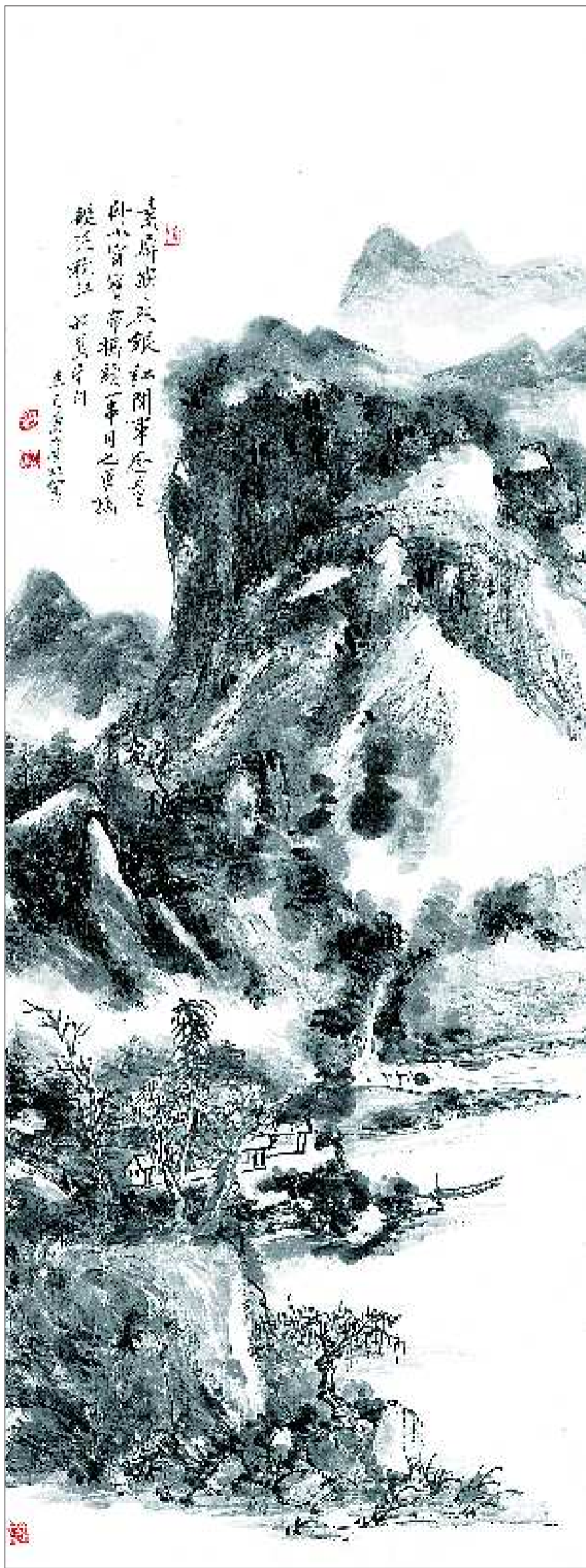
▲黄宾虹《秋江泛艇图》

“素屏寂照银缸，闲事思量卧小窗。宝带桥头一串月，也曾携艇泛秋江。”这是清光绪年间翰林院编修柯逢时的诗句，表现的是秋山碧水、携艇泛江的美景，暗含的则是一种“独卧小窗”的秋日哀愁。1941年，当77岁高龄的黄宾虹把这首诗绘成一幅意境幽远的《秋江泛艇图》时，距离柯逢时写诗已经过去了半个世纪。又是69年过去了，这幅画几经辗转，将于近日现身我省艺术品拍场。