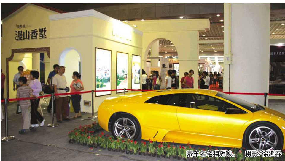
豪车名宅相辉映。