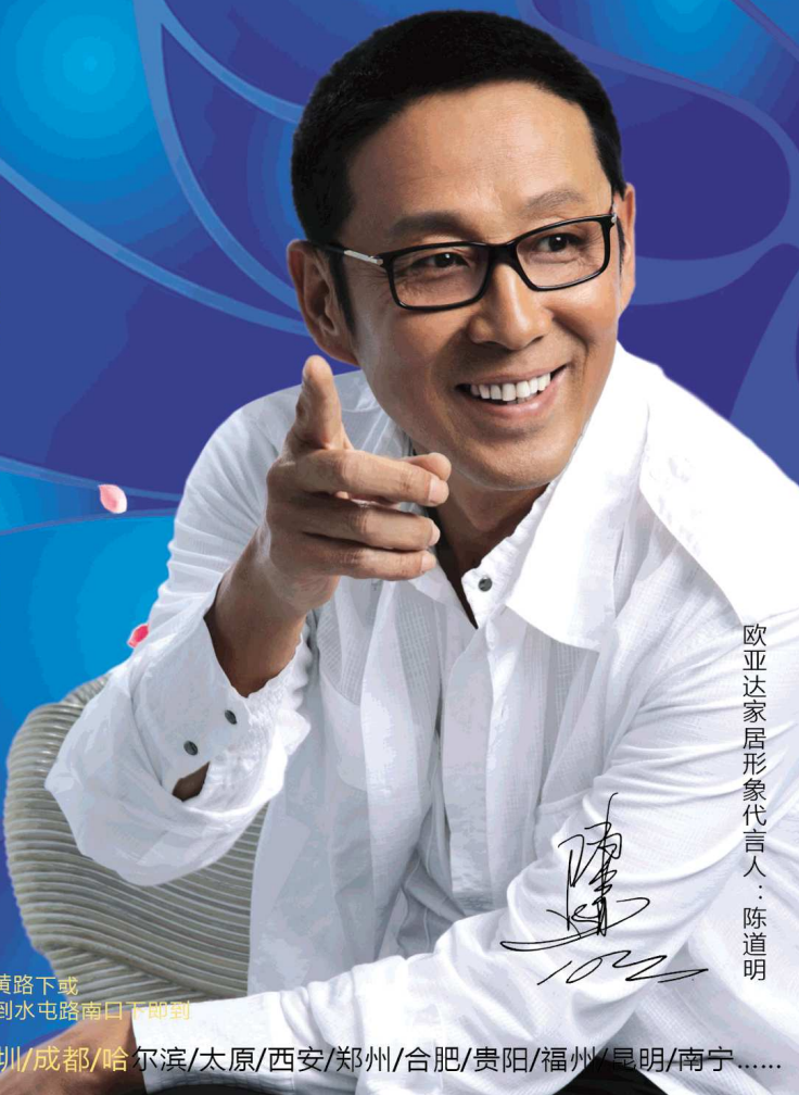
欧亚达家居形象代言人:陈道明