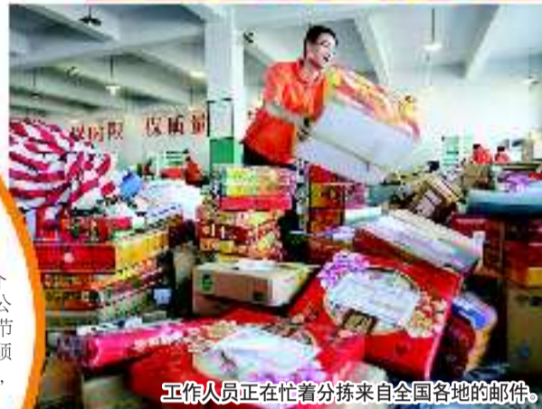
工作人员正在忙着分拣来自全国各地的邮件。