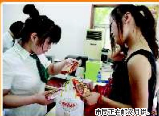
市民正在邮寄月饼。