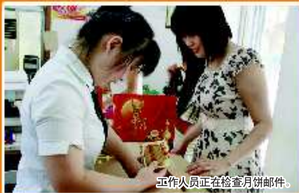
工作人员正在检查月饼邮件。