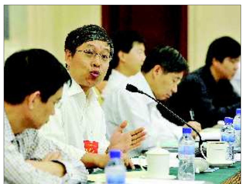
分组讨论中,代表们各抒己见。

“领导干部怎样加强道德建设”、“青少年道德教育陷入困局”、“企业诚信缺失怎么办”……9月21日上午,在第七届中国公民道德论坛分组讨论现场,由于道德缺失引发的热点问题成为与会代表关注的焦点。