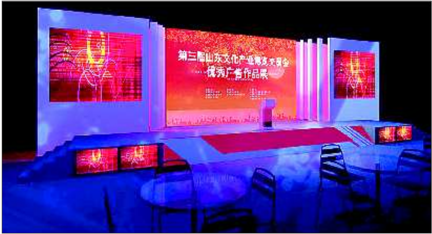
▲山东省工商行政管理局的展馆效果图。