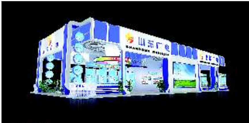
▲山东省广播电影电视局的展馆效果图。

据组委会办公室有关负责人介绍,26日上午40%的场馆将完成搭建工作,下午所有场馆都将按时完工。本届文博会较上届有了新的突破和飞跃,首次出现了省外组团参展,目前确定前来参展的省外展会、政府组团已达8个,参展面积和展位数量比上届分别增加30%和25%。