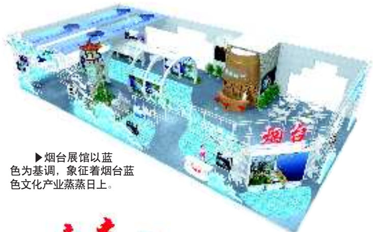
►烟台展馆以蓝色为基调,象征着烟台蓝色文化产业蒸蒸日上。