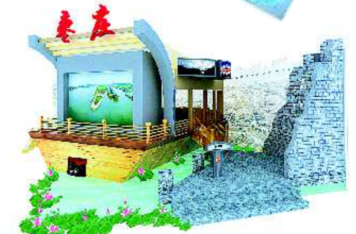
▲枣庄展馆主体造型为大船,象征着枣庄文化产业破浪前行。