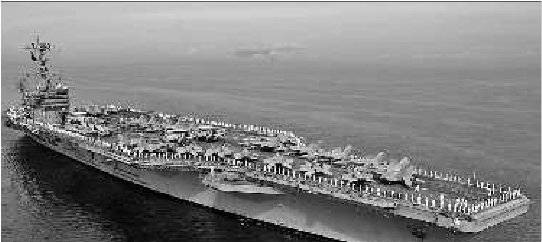
▲“华盛顿”号航母 行踪神秘。(资料片)