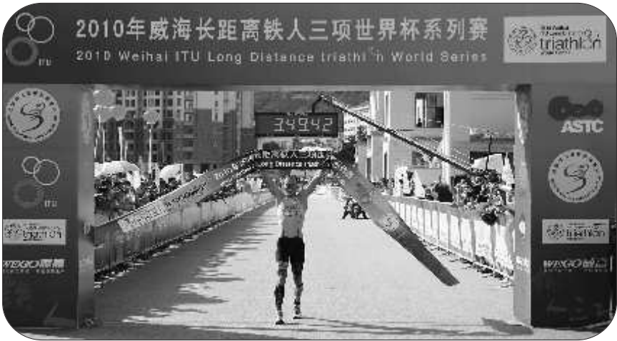
►丹麦选手吉米·约翰森傲视群雄,“淡定”冲过终点线。