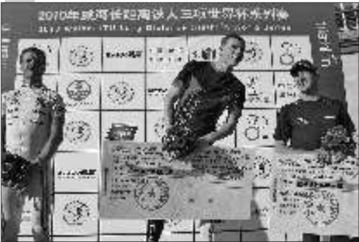
领奖台上,冠军吉米·约翰森四处张望。