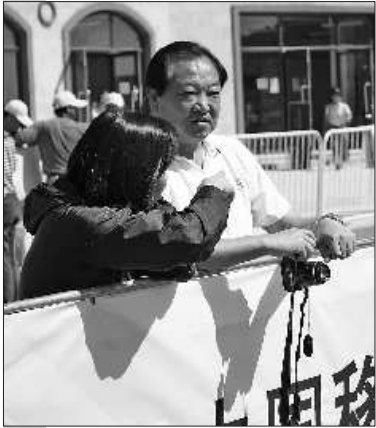
中国奥运首金获得者许海峰到场观看比赛。