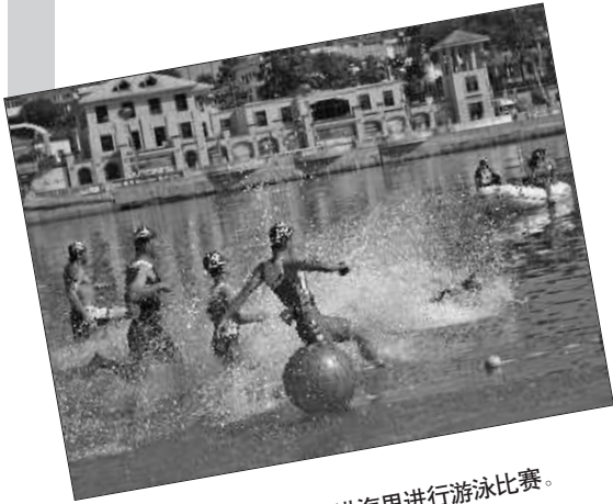
号声一响,选手们大步冲进海里进行游泳比赛。