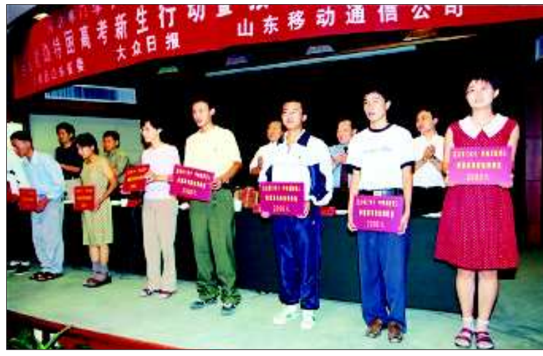
大众日报资助寒门学子公益活动。(资料片)

棋职业联赛、高考咨询活动等,齐鲁晚报每年举办的公益文化活动有50个之多。集团14报5刊1网站各条客服热线、活动热线、读者热线,线线连接着集团与读者的心。