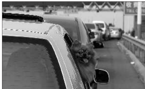
黄金周期间,有的市民带着宠物回家探亲。