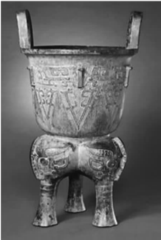
▲ 国宝史孔和就是被赵桐葵藏在这样的甗里面。(资料图)