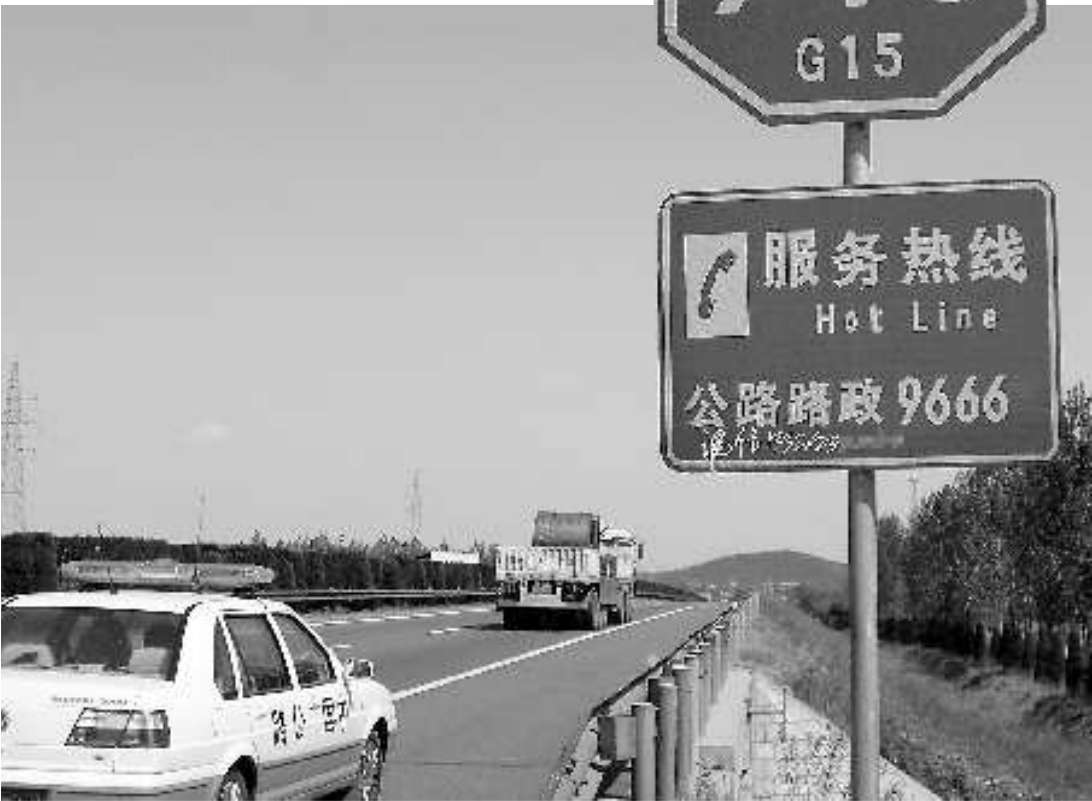
被魏某动过手脚的公路路政服务电话指示牌。