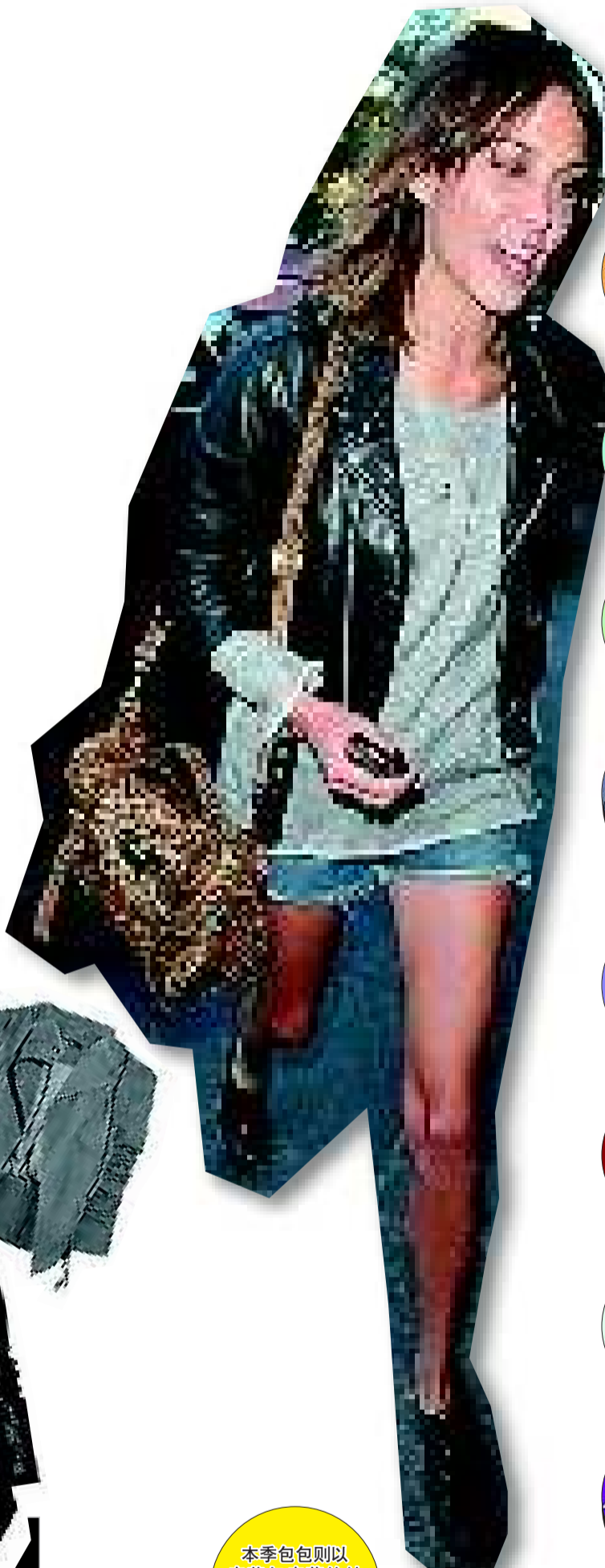
本季包包则以皮革与皮草的结合为亮点,高调的色彩为本季的主打元素。