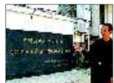
中国共产党党史萃英中学支部委员会成立旧址纪念碑。