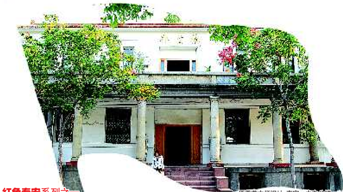
红色泰安系列之一