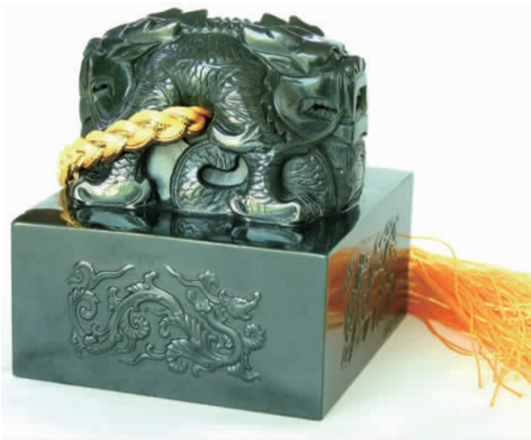
宝玺通高 8.6 厘米，玺钮高 5.6 厘米，代表 56 个民族大团圆；龙纽是威猛霸气的盘龙，龙腹穿孔附系黄色绶带，底部正方形印面边长为 8 厘米，象征中国的四面八方。四面刻有龙、凤、龟、麒麟四大吉祥物，象征龙凤呈祥、健康长寿。印面凸雕篆刻世博会徽，图案形似字“世”，与“2010”巧妙组合，相得益彰。宝玺大气天成，巧夺天工，光耀王者风范！

物以稀为贵，为彰显“世博宝玺”无与伦比的至尊地位和极大的升值空间，全球只发行 2010 尊，仅供少数幸运藏家荣耀典藏。每尊都雕刻唯一限量编号，以后永不复制。每套均由上海世博局授权方可制造，并配有人民币防伪高科技专造的世博特许标签和国家出具的玉石《鉴定证书》，鉴定结论尊尊均为和田玉。