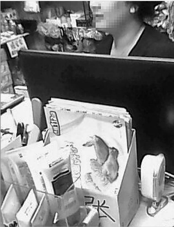
市区一家店铺里，肯德基优惠券摆在醒目位置，每张卖2元。

元一张！” 这些优惠券是哪来的？一家报亭的老板透露，每个月会有几个人定期送来优惠券，报亭每卖出一张就有提成。“那些人我也不知道是哪的，反正卖出去我们分成。”老板说。 而在一些彩票投注站和商场中，买彩票，投注站的老板会送上几张肯德基优惠券。在商场购物，商场也会送出优惠券。“这些优惠券也是别人给我的，我也知道他们从哪里弄来的。我留着也用不完，就给一些熟人，就当送个人情了。”兴华路一家彩票投注站的老板说。