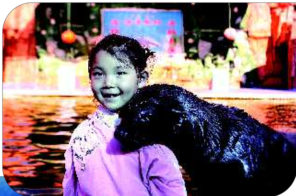
和小朋友在一起,“乐乐”挺乖的。

本报“视窗”版与读者见面了。这是一个专门为咱普通百姓、摄影发烧友推出的版面。只要您喜欢,拿起相机去拍吧,构图歪斜不要紧,对焦不准也没关系,只要您善于捕捉平凡生活中或生动、或有趣、或感人的画面,都可用相机或手机拍下来上传给我们。对于质量好、创意好的作品,还有奖励哦。投稿邮箱:jrytpk@sina.com。来稿请注明作品拍摄时间、地点、内容简介及作者姓名与联系方式。