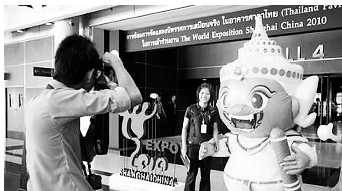
泰国馆最终会落户山东吗?(资料片)

黄浦江畔逐渐形成了被誉为“万国建筑博览”的外滩这一上海标志建筑群;上世纪的最后十年,同样在黄浦江畔的浦东陆家嘴又形成了高楼林立的又一处上海标志建筑群。我们相信,在本世纪的头十年,还会有一处新的上海标志建筑崛起,这就是世博中心,它无疑有资格引领今后一段时期的建筑风潮。”