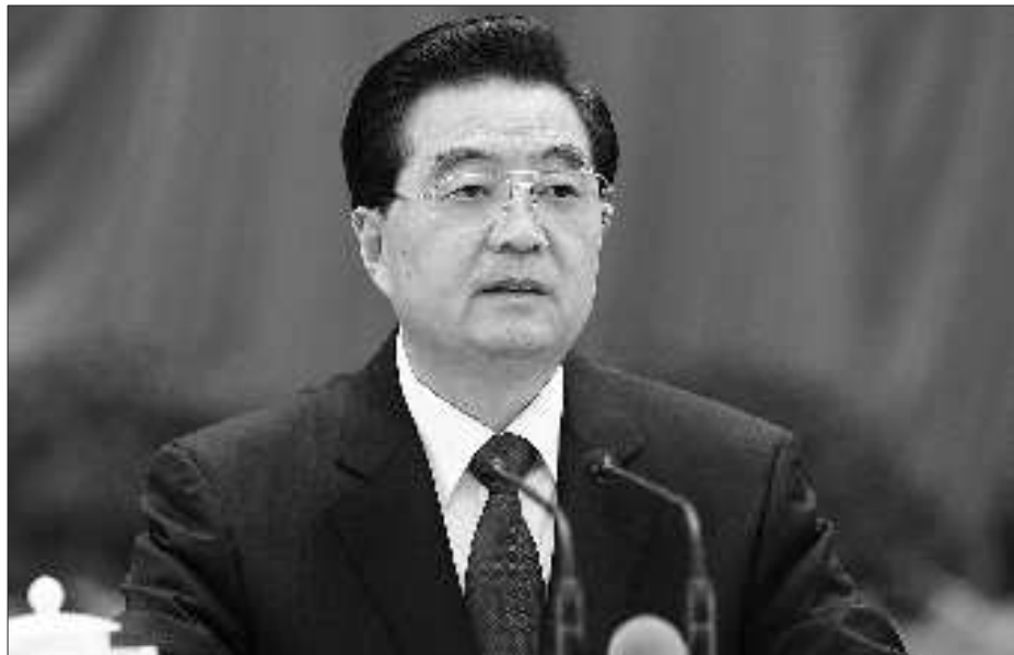
中国共产党第十七届中央委员会第五次全体会议,于10月15日至18日在北京举行。全会由中央政治局主持,中央委员会总书记胡锦涛作重要讲话。新华社发

展文化事业和文化产业,满足人民群众不断增长的精神文化需求,基本建成公共文化服务体系,推动文化产业成为国民经济支柱性产业,充分发挥文化引导社会、教育人民、推动发展的功能,建设中华民族共有精神家园,增强民族凝聚力和创造力。