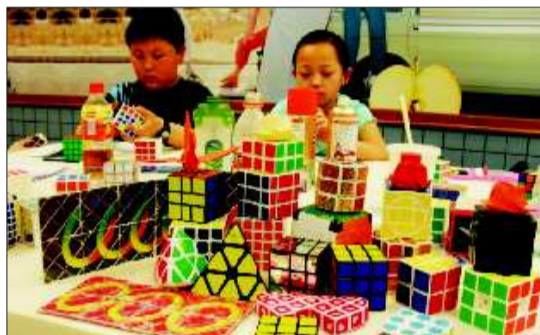
魔板、心形、苹果、三角等形态各异的魔方，吸引越来越多的年轻人从事这项运动。